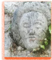
Barre la ligne 3