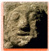
Barre la ligne 4