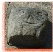
Barre la ligne 5