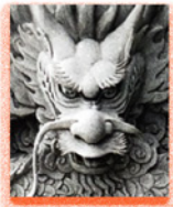
Barre la ligne 2