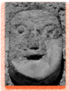
Barre la ligne 1

Parmi ces cinq têtes, laquelle retrouves-tu sur une façade ?